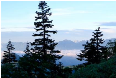
高谷池ヒュッテから北アルプス