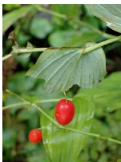
オオバタシロラン 実