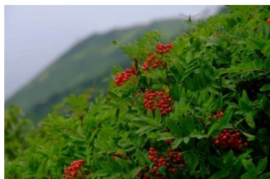
ウラジロナナカマド 実