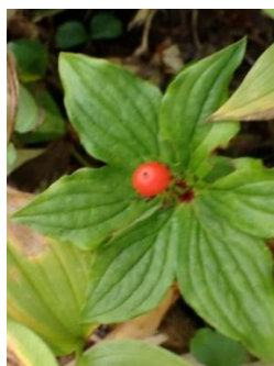
ゴゼンタチバナ 実