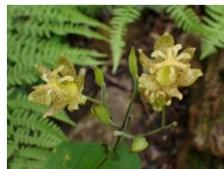
タマガワホトトギス