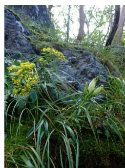
トウヤクリンドウとコキンレイカ