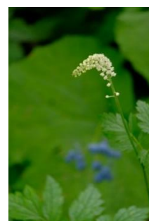
サラシナショウマ