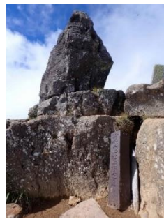
南峰 (2,454m) 妙高大神