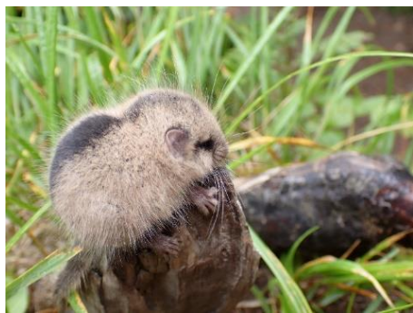
天然記念物 ヤマネ