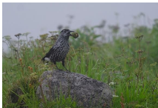
ハイマツの実をくわえたホシガラス