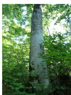
笹ヶ峰一周歩道 ブナ林