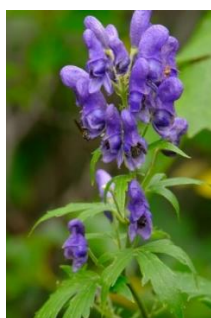
ミョウコウトリカブト